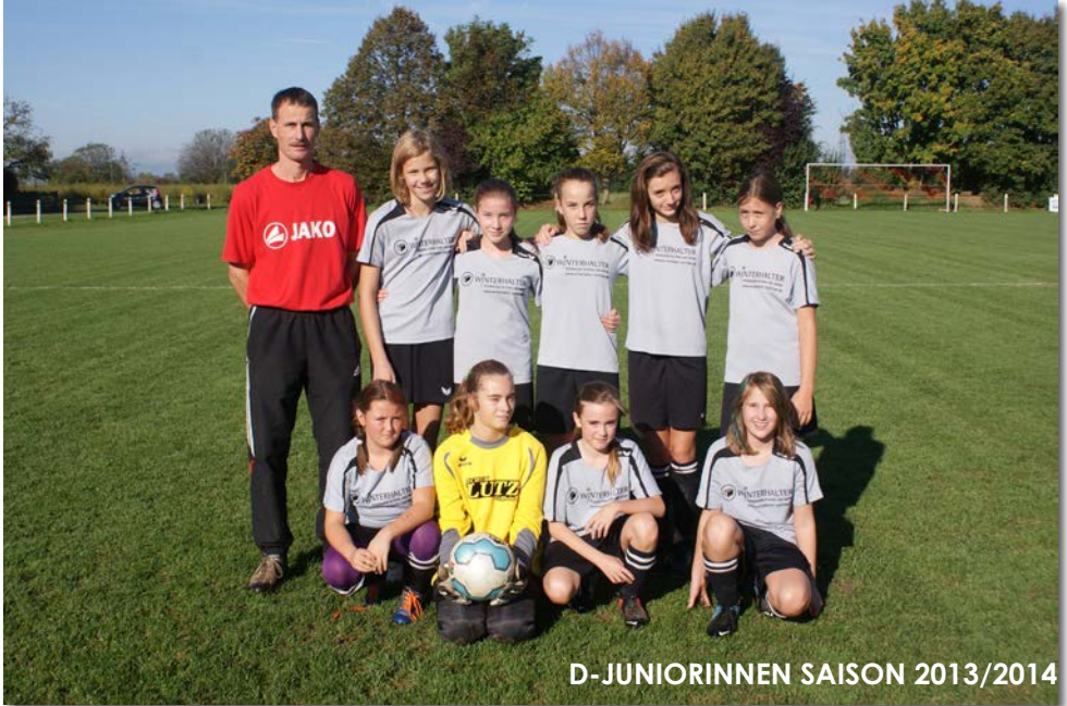
D-JUNIORINNEN SAISON 2013/2014